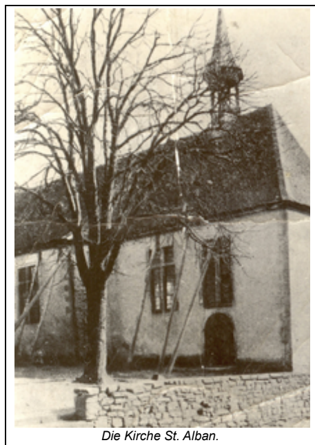
Die Kirche St. Alban.

Nachdem in Januar 1894 alle Pläne des Neubaus genehmigt und in den folgenden