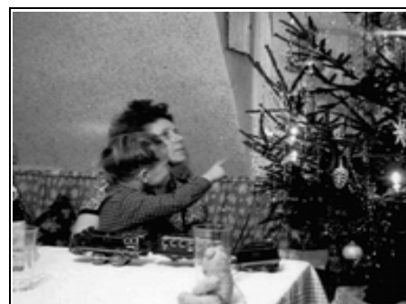
Mama und Sohn erfreuen sich am Weihnachtsbaum

HUGV_Schweinheim_MTB_20251218_Advent_Weihn_Oeffnung_KW51