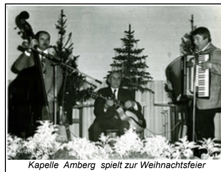
Kapelle Amberg spielt zur Weihnachtsfeier