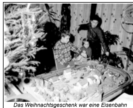
Das Weihnachtsgeschenk war eine Eisenbahn