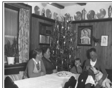
Familie Krug an Weihnachten