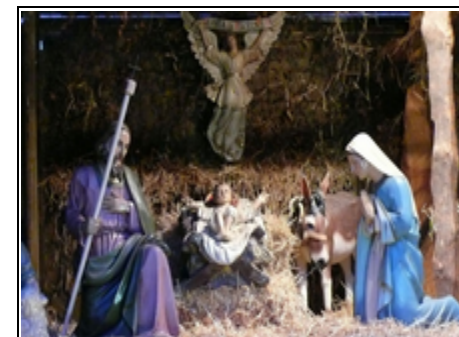
Krippe auf dem Weihnachtsmarkt