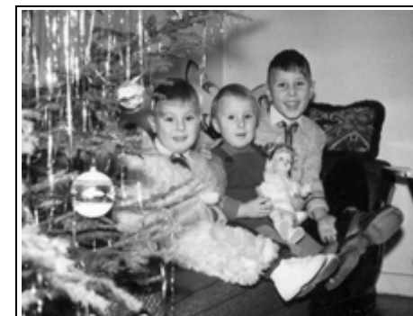
Kinder der Familie Beetz in Weihnachtsstimmung